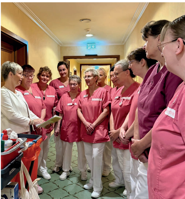
Das Team der Hauswirtschaft bei der Besprechung