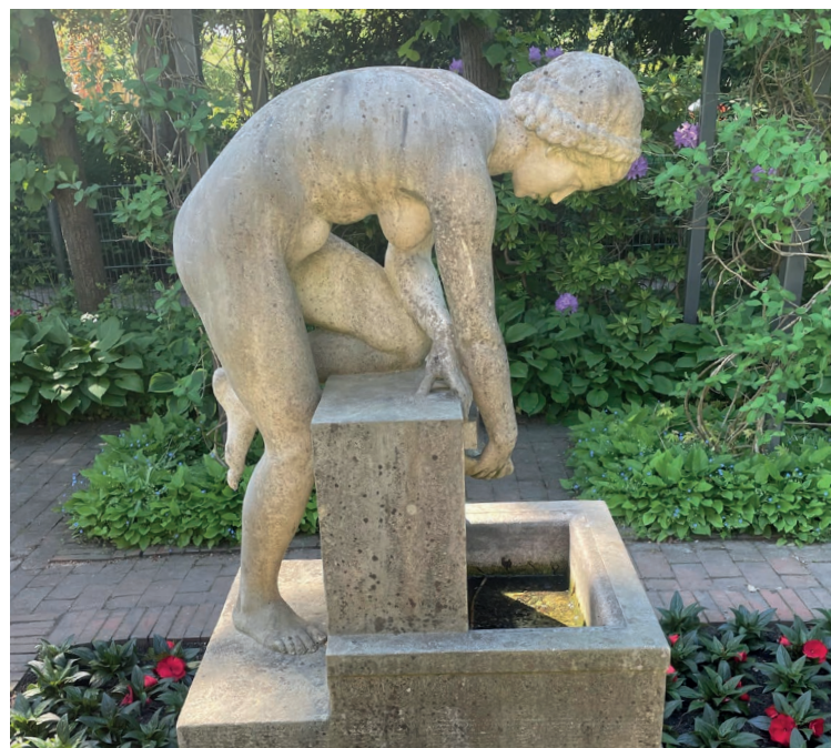
Die Wasserschöpfende Dorothea

strahlenden Pfingstmontag ein mir endlos scheinender Laubengang zum kühlen Erwägen des weiteren Vorgehens. Lasse ich mich treiben oder gibt es evtl. ein unaufdringlich wegweisendes Konzept in der Anlage der botanischen Vielfalt? Ich befreie mich von dem Anspruch, den der Name vorgibt, und beschließe, mich von diesem in seiner Ordnung ungestümen Biotop treiben zu lassen.