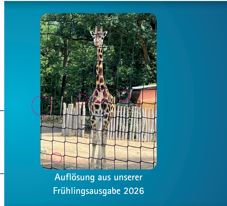
Auflösung aus unserer Frühlingsausgabe 2026

Es gilt der Poststempel. Die Gewinner werden von uns informiert.