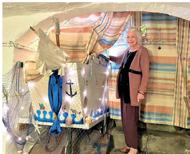
Die Babyklappe von Innen

1995 wird das Haus in der Mengstraße zum Agape-Haus. „Agape“ – ein griechisches Wort für bedingungslose Liebe. Ich liebe dich, so wie du bist. Hier finden Frauen Zuflucht. Minderjährige Schwangere, misshandelte junge Frauen, Alleinerziehende, aktuell