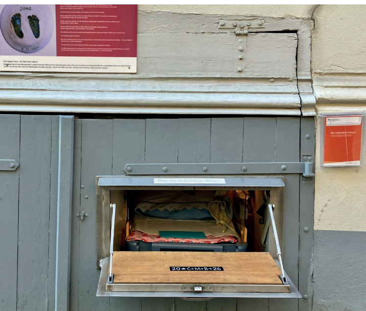
Die Babyklappe von Außen

Mensch und als Mutter. Zwei Suizidversuche liegen hinter ihr. Der Wendepunkt kommt leise und gottgewollt, davon ist sie überzeugt. Eine Inspiration fast wie ein Auftrag: Wenn du Hungrige aufnimmst, wird es dir besser gehen. Sie beginnt, ihre Tür zu öffnen für Menschen in Not, und sie spürt: Es ist stimmig, für andere nah und da zu sein.